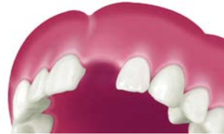
Situation nach Zahnverlust