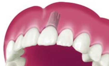
Mit Zahnkrone versorgtes Implantat