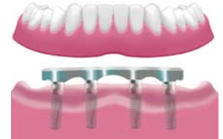
Verankerung der Prothese mit einem Steg