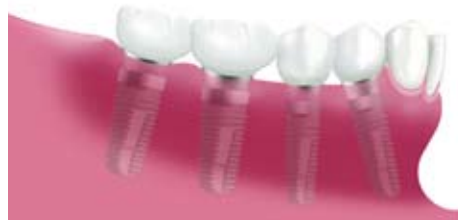
Vier einzelne Zahnkronen auf vier Implantaten

So sieht eine Freundsituation aus. Die Zahl der Implantate hängt ab von der Größe der Lücke, der Belastung und den Gegebenheiten in Ihrem Kiefer.