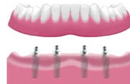
Verankerung der Prothese mit Kugelaufbauten