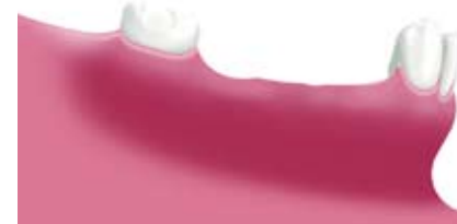
Situation nach Verlust mehrerer Zähne (Schaltlücke)