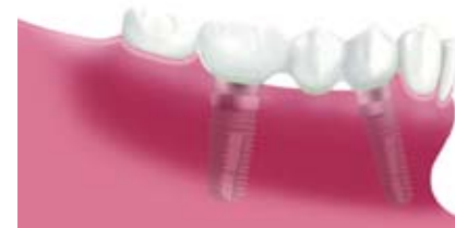
Dreigliedrige Brücke auf zwei Implantaten