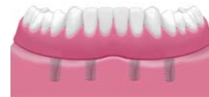
Implantatgetragene herausnehmbare Prothese