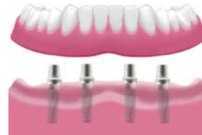
Verankerung der Prothese mit Doppelkronen