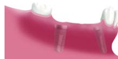
Zwei eingebaute Implantate